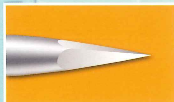
マイクロカット Microcutting point